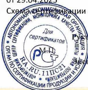
Схема сертификации 4.

Акта оценки оказания услуг проживания в санатории № 1057 от 30.04.2025; протокола проверки результата оказания услуг проживания в санатории № 685 от 29.04.2025